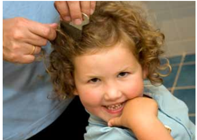
De uitkammethode is het meest natuurlijke middel tegen hoofdluis

In de vorm van shampoos, sprays, crèmes en lotions zijn verschillende producten te verkrijgen. Het verschil tussen de producten heeft vooral te maken met de werkzame stof die erin zit. Op dit moment biedt geen enkel antihoofdluismiddel 100 % 'garantie'. Informeer naar bijwerkingen en contra-indicaties, want kinderen met hooikoorts, cara of eczeem kunnen gevoelig zijn voor één van de werkzame stoffen. Lees ook de bijsluiter goed door en volg de werkwijze die daarin staat. Na 1 week dient u de behandeling met het antihoofdluismiddel te herhalen. Bovendien moet de behandeling met antihoofdluismiddelen gecombineerd worden met de uitkammethode: twee weken het haar dagelijks doorkammen met een fijntandige kam, in combinatie met crèmespoeling.