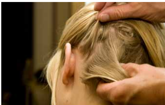
Als u op hoofdluis controleert, kijk dan goed tussen de haren.