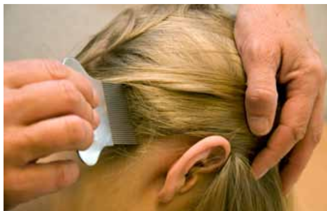
Kam het haar met een fijntandige kam boven een wit papier of de wasbak.